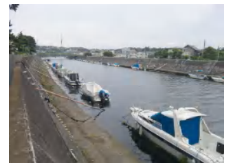
境川下流部(鵜沼・片瀬地区)

引地川や境川の護岸に降りて釣りをしたり、繋がれているボートに乗ったりして遊ばないでください。 川は水深が深く流れも早い上、満潮時には護岸の上にも水が上がってきます。また、上流で降った大雨で急に増水する事もあります。