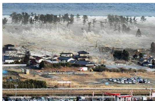
3/11 宮城県名取市を襲う大津波

今回の大震災では、「まだ津波が来ないから、コートを取りに家に戻る」、「お金も何も無いから家に戻る」、「外は寒いから家の二階に居る」等、一度逃げたにもかかわらず戻って津波の被害にあった方が多数います。迷いは禁物です。